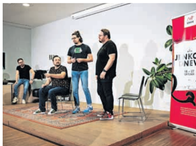
Klub nesmrtnih pesnikov z odličnimi improvizatorji KUD Kiks / FOTO: PRIMOŽ PIČULIN