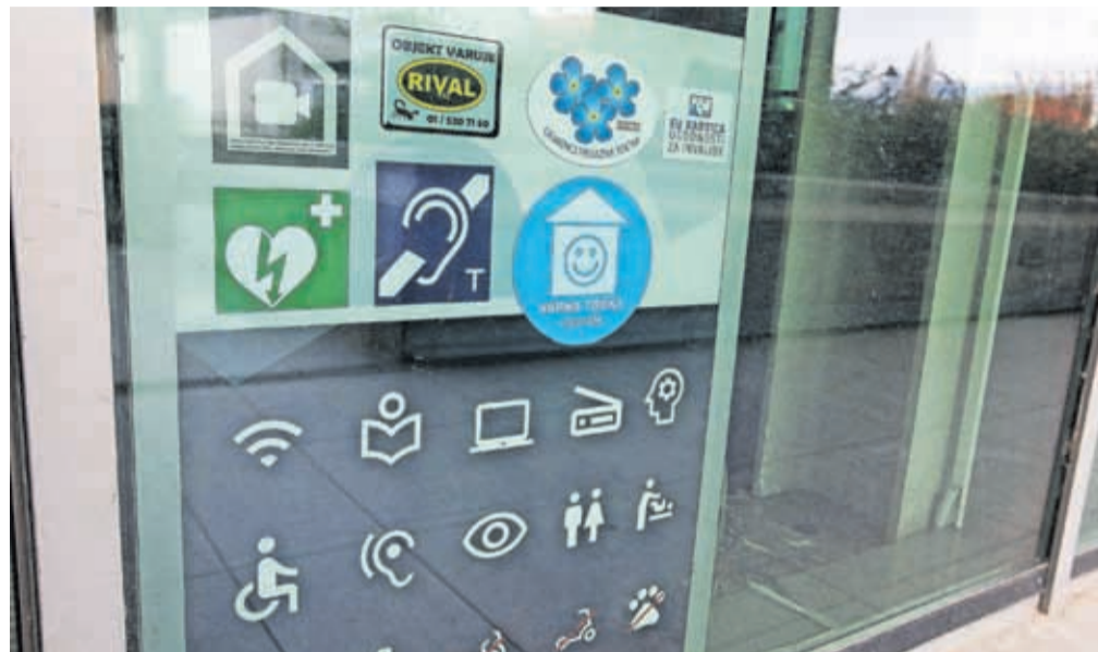
Varne točke prepoznamo po modri nalepki z belo smejočo se hišico, ki je nalepljena na vhodu v javni prostor.

V varni točki se otroku oziroma mladostniku zagotovi varen prostor, omogoči se mu pogovor in se mu prisluhne, se ustrezno reagira. Vsi zaposleni gredo namreč skozi usposabljanje, ki ga organizira Unicef Slovenije, kjer se pripravijo na to, kako reagirati ob prihodu otroka in mladostnika, kako z njim komunicirati ter na katero pristojno institucijo se je treba obrniti, kadar je potrebna strokovna pomoč. V mestni občini Kranj je trenutno sedemnajst varnih točk, kamor se otroci in