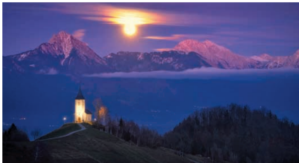
Jamnik ob polni luni

V primeru slabega vremena bo pohod prestavljen na naslednjo polno luno, 26. novembra. Zaradi lažje organizacije pohoda so zaželeni predhodne prijave na spletni strani Zavoda za turizem in kulturo Kranj.