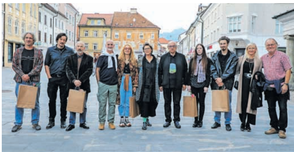
Mednarodni festival likovnih umetnosti Kranj – ZDSLU