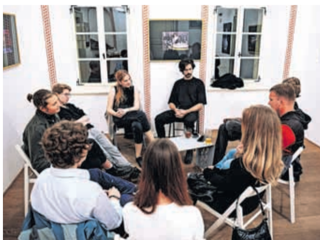
Mladi pesniki na delavnici slam poezije SOS slam

kar pomeni, da je bilo predstavljenih tudi nekaj pesnikovih »pred kratkim nastalih in še neobjavljenih pesmi«.