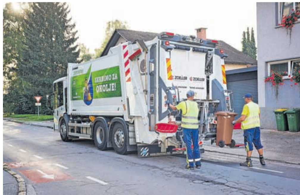
Povprečen uporabnik v Kranju zavrže slabih sto kilogramov bioloških odpadkov na leto.

Na področju ločenega zbiranja na izvoru so lokalne skupnosti in komunalna podjetja dosegli zavidljivo raven, po drugi strani pa država ni poskrbela za nadaljnjo predelavo, saj se samo 15 odstotkov ločeno zbranih odpadkov predela v Sloveniji. Tako